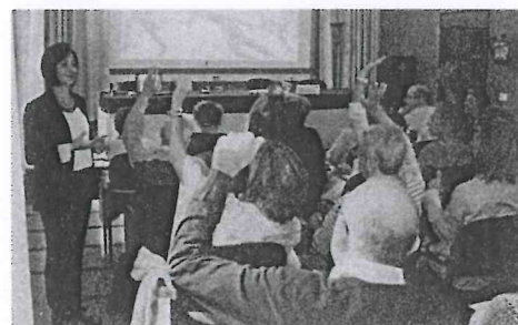
Los alumnos participando en clase