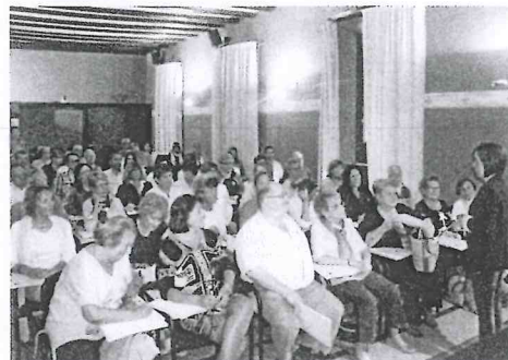
El salón de actos lleno de alumnado