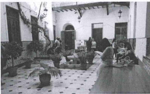
Dependencias de la UNED en Almería

ALMERÍA.- El Comité de certificación del Sistema de Garantía de Calidad en la Gestión de Centros Asociados de la UNED (SGICG-CA), asignado por la Cátedra de Calidad de la UNED Ciudad de Tudela, ha emitido un informe favorable sobre el centro asociado de la UNED en Almería, tras realizar un seguimiento y estudio del mismo en meses anteriores. "Un hecho que viene a refrendar el trabajo que venimos realizando en nuestro centro para ofrecer los mejores servicios a nuestros alumnos", considera el directo del